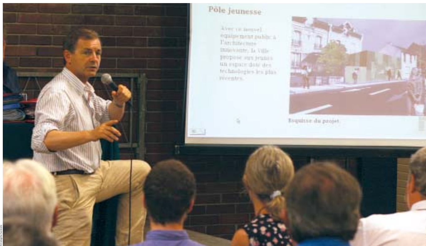
Présentation des projets du quartier Centre-ville à l'école Maurice-Velter.