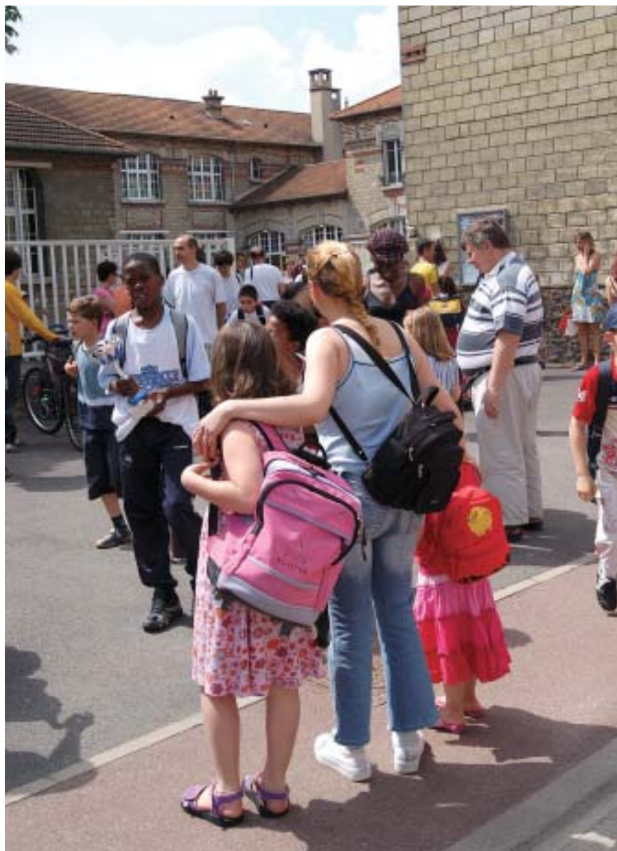
Le premier jour d'école, un événement important pour les enfants mais aussi pour leurs parents.

Léon-Frapié : réfection de l'encadrement extérieur des portes et fenêtres de la salle de restauration.