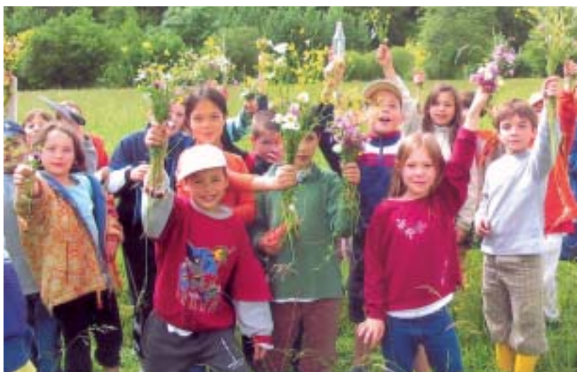
Les classes de découverte sont un temps fort dans la vie des écoliers. Ci-dessus, une classe « nature » sur le thème de l'environnement.

L'opération « balle ovale » a permis à près de 700 élèves de s'initier au rugby, un sport collectif porteur de valeurs éducatives et sportives. Ci-contre, le tournoi interécoles le 9 juin dernier au stade Robert-Barran.