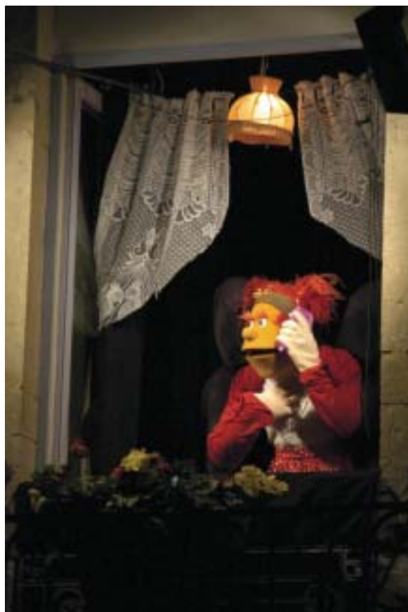
La mairie est transformée en castelet géant pour un spectacle de marionnettes pas banal présenté par la compagnie Délit de façade.

La mairie de Houilles comme espace scénique : il faut y penser ! Sur deux étages, la compagnie Délit de façade installe, le 24 septembre, ses marionnettes aux fenêtres de l'Hôtel-de-Ville dans un spectacle intitulé « Autrement dit ». L'intention du metteur en scène, Alain Sachs, est d'« investir un lieu public pour en faire un lieu de théâtre et de rêverie sans le dénaturer, mais au contraire en le sublimant ». Notamment, grâce aux figurines créées par Alain Duverne, concepteur de celles du « Bêbête Show » et des « Guignols de l'info ». Mais la référence s'arrête là, car elles n'ont rien à voir avec les histoires humoristico-politiques des marionnettes télévisuelles qui nous sont si familières. Comme l'explique la compagnie, « cette création explore une nouvelle écriture, une nouvelle manière de dire, plus burlesque, fantastique et absurde ». Du papy ronchon au bébé brailleux en passant par la jeune fille qui s'amourache facilement, ce sont 11 membres de deux familles, l'une plutôt modeste, l'autre plus bourgeoise, qui vont transformer le quotidien en extraordinaire. À travers six scènes de vie, et grâce à une dizaine de manipulatrices, ces personnages hauts en couleur s'animeront pour une saga familiale pleine d'humour propre à ravir tous les âges. À coup sûr, l'ouverture de la saison culturelle se fera dans l'originalité et la bonne humeur. ■