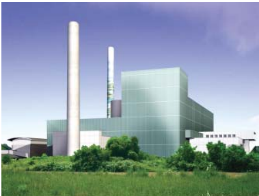
Projet architectural de l'usine d'incinération de Carrières-sur-Seine.

L'usine d'incinération de Carrières-sur-Seine rénove son système d'exploitation.