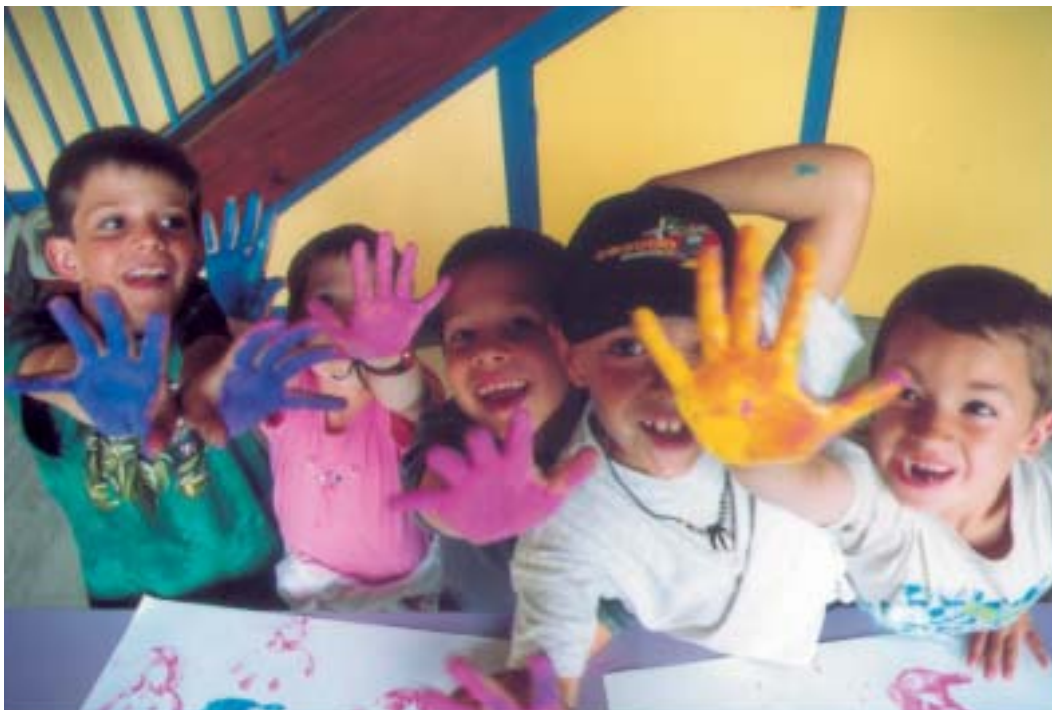
Le centre de loisirs Jacques-Yves-Cousteau favorise l'éveil des enfants par la découverte d'activités variées.