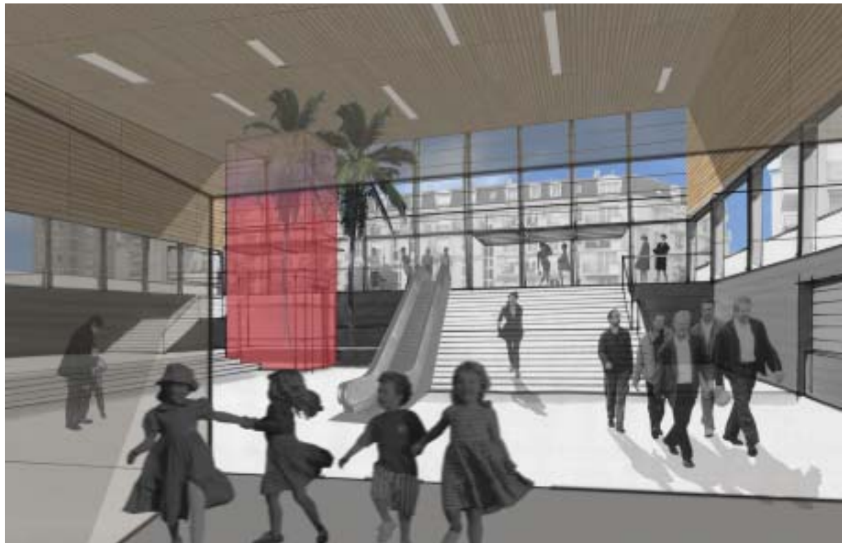
Fin 2007, la gare sera entièrement rénovée. Ci-dessous, le grand hall vitré de la rue Robespierre avec ascenseur et escalier mécanique.

Le Plan de déplacements urbains (PDU) d'Île-de-France définit les principes d'organisation des déplacements des personnes, de la circulation et du stationnement. Ses orientations doivent participer à diminuer le trafic automobile et à renforcer l'usage des modes alternatifs, notamment les transports publics. Dans le cadre de cette démarche, la gare de Houilles-Carières a été choisie pour figurer parmi les points de connexion à développer. Pour ce faire, un comité de pôle a réuni, début 2004, tous les partenaires concernés (commune, institutionnels, techniques et associatifs) pour établir un programme d'actions suivant une démarche concertée. Dans les grandes lignes, le projet prévoit une amélioration des services (information, signalétique, accueil, sécurité...) et des aspects fonctionnels (accessibilité à tous, fonctionnement des différentes circulations, stationnement des vélos et des véhicules...). Ces travaux ont été élaborés de manière cohérente et complémentaire avec ceux de mise en accessibilité PMR (personnes à mobilité réduite) entrepris par la Région Île-de-France, la Ville de Houilles, le Réseau ferré de France (RFF) et la SNCF. Le chantier devrait s'achever à l'horizon 2007. Le finance-