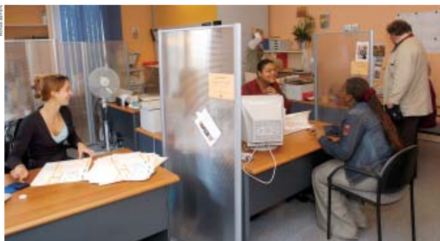
La personne qui héberge doit se rendre au service d'État civil pour obtenir l'attestation d'accueil.