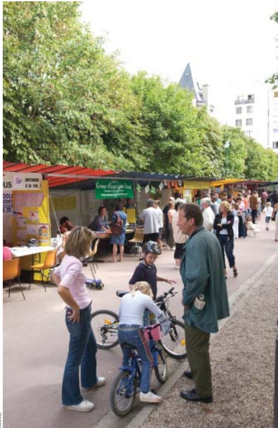
Plus de 40 associations sont réunies, parc Charles-de-Gaulle, à l'occasion de leur forum.

Les associations locales sont répertoriées, avec leurs activités et leurs coordonnées, dans 30 000 Ovillois, Guide pratique 2005 , disponible à l'accueil de la mairie (16, rue Gambetta) ainsi que sur le site Internet www.ville-houilles.fr