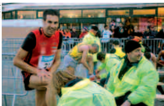
L'organisation est assurée par quelque 300 bénévoles.