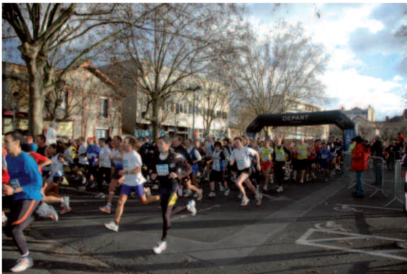
Pour l'ensemble des participants de la Corrida pédestre internationale de Houilles, la motivation est la même : le plaisir de courir !

Autre préoccupation : celle d'offrir un « plateau » de haut niveau pour la « course des as ». « Pour l'édition 2010, confie Patrick Cadiou, responsable du "plateau", la Cor-