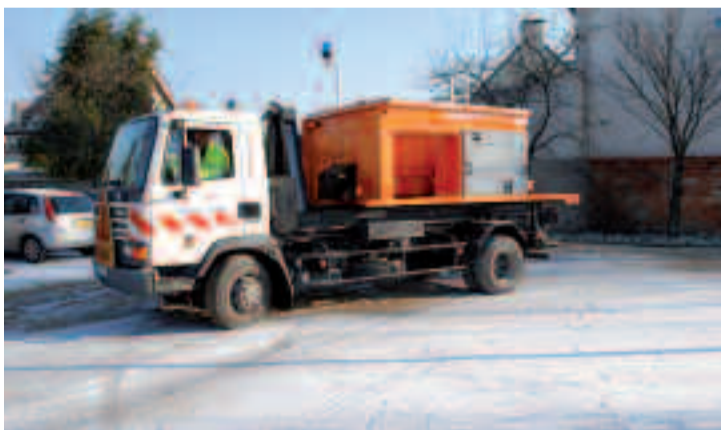
L'une des deux sableuses de voirie de la Ville.

Depuis le 25 novembre, les agents des services techniques de la Ville sont entrés en période d'astreinte hivernale. En cas de chute de neige ou de gel, 7 jours sur 7, 24 heures sur 24, ils sont prêts à intervenir pour dégager et sécuriser les axes routiers de la commune. Dès que les conditions météorologiques l'exigent, les quatre agents « de veille » et deux sableuses de voirie entrent en action. Mission : dégager les différentes artères de la ville selon un périmètre éta-