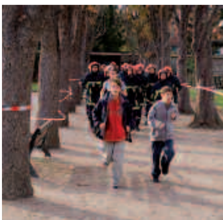
De nombreux Ovillois se mobilisent à l'occasion du Téléthon.

Village du Téléthon : vendredi 3 décembre, à partir de 18 h, jusqu'au samedi 4 décembre à minuit. Gymnase Ostermeyer (rue Louise-Michel). Faites un don au 3637 ou sur www.telethon.fr