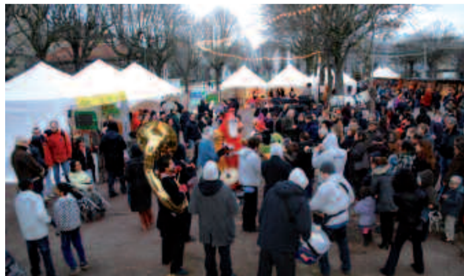
Le traditionnel marché de Noël, dans le parc Charles-de-Gaulle.