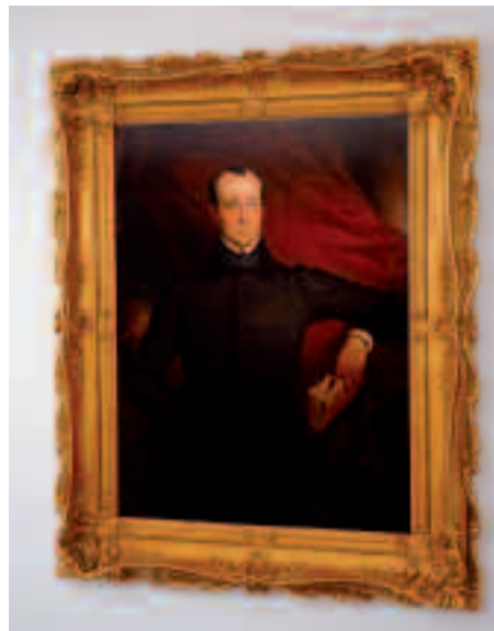
Portrait de Victor Schœlcher (1804-1893) par Henri Decaisne, 1832 (huile sur toile).

teur de la visite de cette exposition. À travers quatre grandes thématiques, une centaine de pièces rares (gravures, documents, livres anciens et objets) y sont présentées. Elles proviennent de fonds privés et publics, dont un grand nombre est issu de nos archives municipales. L'exposition s'ouvre sur la vie de Schœlcher et en rappelle les différentes étapes. « J'ignorais qu'il s'était aussi battu pour le suffrage universel, le droit des femmes et des enfants et l'école laïque », constate un visiteur. La salle attenante nous fait découvrir les moindres détails de la traite des esclaves. Les gravures de l'île de Gorée (Sénégal) et des ports négriers montrent ces hommes embarqués à fond de cale, fers aux pieds. Les conditions de vie dans les plantations, les violences et les discrimina-