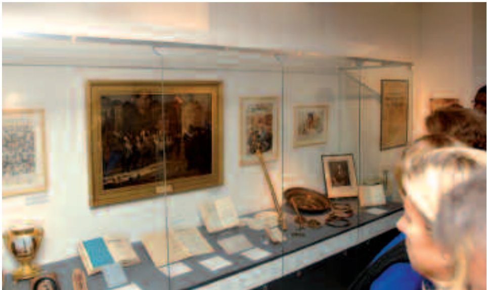
L'exposition « Combats pour une abolition : sur les pas de Victor Schœlcher » rassemble une centaine de pièces rares : gravures, documents, livres anciens et objets.

Victor Schœlcher dénonça l'esclavage sans relâche, jusqu'à son abolition en 1848. L'exposition qui se tient en ce moment à l'Orangerie du domaine de M me Elisabeth à Versailles retrace ce long combat vers la liberté et nous plonge au cœur du XIX e siècle. Un siècle que l'abolitionniste Victor Schœlcher a traversé en républicain convaincu, engagé dans toutes les luttes politiques de son époque en faveur des libertés. Auteur du décret d'abolition de l'esclavage, Schœlcher combattit sans merci l'esclavage et la traite négrière, rapportant de ses voyages dans les colonies des témoignages précis et documentés.