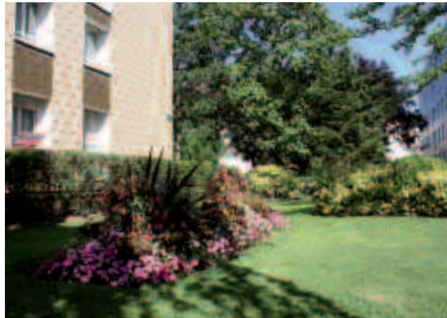
De gauche à droite : 1 er prix dans la catégorie « Maisons avec jardin visible de la rue » ; 1 er prix dans la catégorie « Ensembles urbains ».

La mairie a à cœur d'embellir la ville ! Chaque année, elle prend part au concours « Villes et villages fleuris » et encourage, en parallèle, les Ovillois à participer à celui des « Balcons et jardins fleuris ». Ce concours est bénéfique à plus d'un titre car, non seulement, il récompense l'effort de fleurissement des habitants mais il contribue également à l'embellissement de notre ville. Ce concours débute au printemps et se termine en automne par son « bouquet final » : la soirée de remise des prix à l'hôtel de ville, présidée par le maire, à laquelle tous les partici-