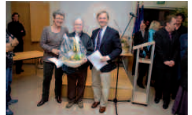
Soirée de remise des prix du concours « Balcons et jardins fleuris » (édition 2009).

Et le soir de la remise des prix, tous les participants auront le plaisir de repartir avec un panier garni (de graines, bulbes, pensées, plantes vivaces) et une composition florale concoctée par les jardiniers de la Ville.