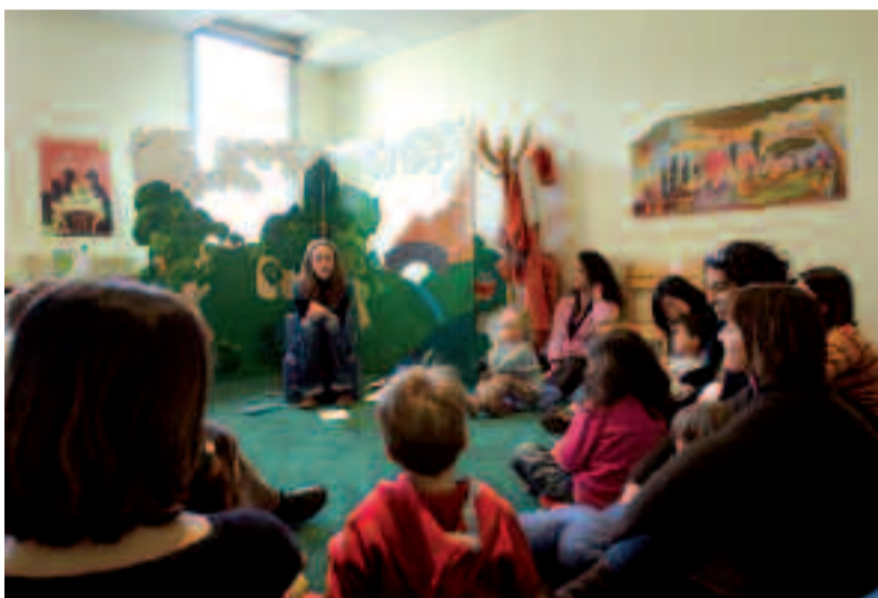
Séance de lecture de contes à la bibliothèque Jules-Verne.

Durant le mois de décembre, le conte revêt un caractère tout particulier. C'est une période propice à la lecture d'histoires merveilleuses. La bibliothèque Jules-Verne donne rendez-vous aux tout-petits pour des séances qui mettent à l'honneur des contes « coup de cœur » puisés dans l'édition jeunesse. Des récits racontés simplement mais toujours avec passion :