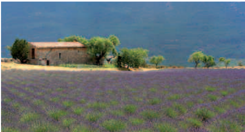
Un champ de lavande en Provence.

La Provence s'écrit avec la lumière et le chant des fontaines. Dans son film documentaire Provence, les chemins de l'eau , diffusé à la Graineterie, le 8 décembre, le réalisateur Jean-Jacques Horem est allé à la rencontre de cette terre de contrastes, où l'eau raconte à elle seule les méandres d'une histoire provençale. Des glaciers des Alpes du Sud aux calanques de Cassis, des pentes du mont Ventoux aux marais de la Camargue, dans ce pays gorgé de soleil mais parfois aride, les hommes ont su développer très tôt la maîtrise de l'eau. Une architecture spécifique, élaborée par les Provençaux depuis les Romains, en est le parfait témoignage. Aqueducs et autres ouvrages d'art témoignent de cette volonté de dompter l'eau, de la canaliser pour l'ap-