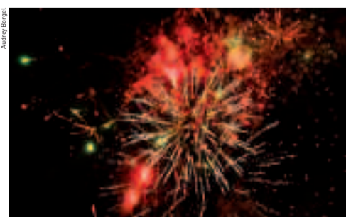
Un feu d'artifice tiré, à 18h, du parc Charles-de-Gaulle clôture l'événement.

Le 26 décembre, dès 19h, tous les résultats sont en ligne sur le site Internet de la Ville : www.houilles.fr