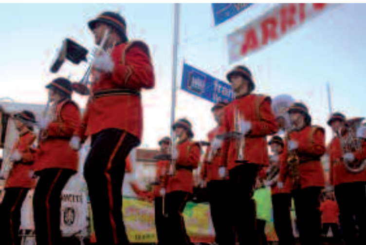
La Corrida s'ouvre en fanfare dès midi avec quatre formations musicales qui sillonnent le centre-ville.