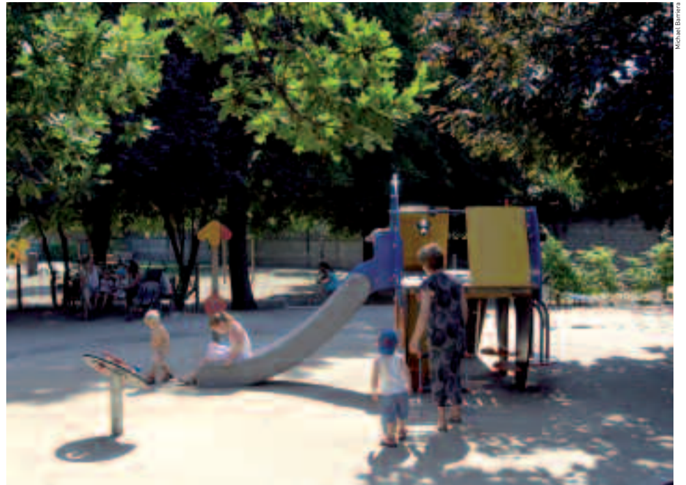
Houilles participe, pour la première fois, au Prix de la ville ludique 2006, qui récompense une politique exemplaire d'aménagement d'aires de jeux.