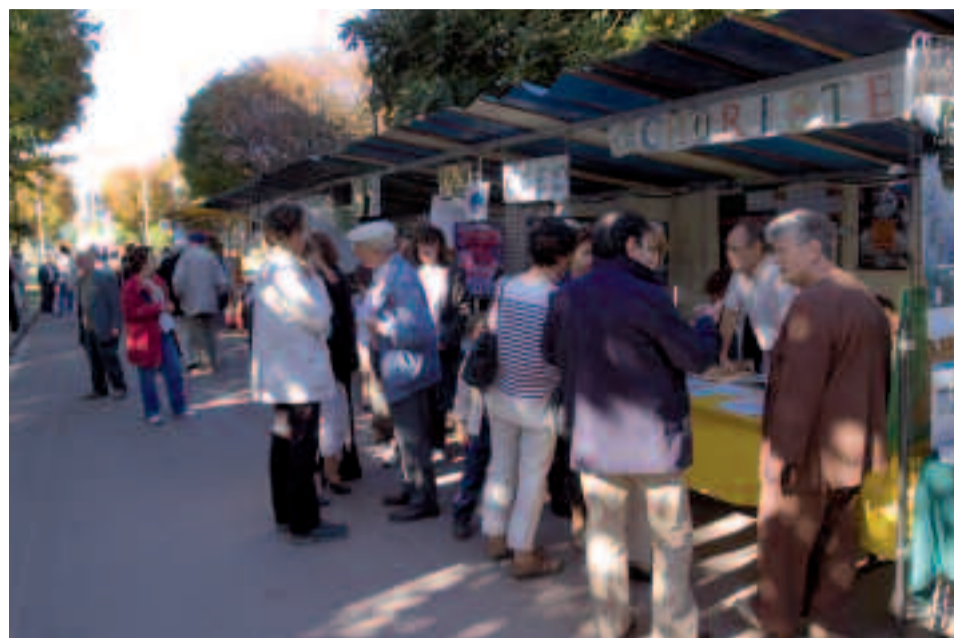
Plus de 40 associations locales sont réunies à l'occasion de leur forum dans le parc Charles-de-Gaulle (ci-dessus l'édition 2005).

Forum des associations : samedi 23 septembre, de 10h à 18h. Parc Charles-de-Gaulle. Pour en savoir plus sur la vie associative, consultez le site Internet de la ville www.ville-Houilles.fr (rubrique Sports et Culture) ou la publication 30 000 Ouillois, guide pratique 2006 , disponible à l'accueil de la mairie.