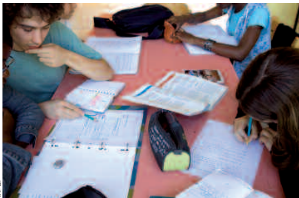
Les séances d'accompagnement scolaire se font par petits groupes au centre de loisirs Cousteau.

Renseignements : service Jeunesse / Houilles information jeunesse, Le Ginkgo (7-9, boulevard Jean-Jaurès). Tél. : 01 61 04 42 63.