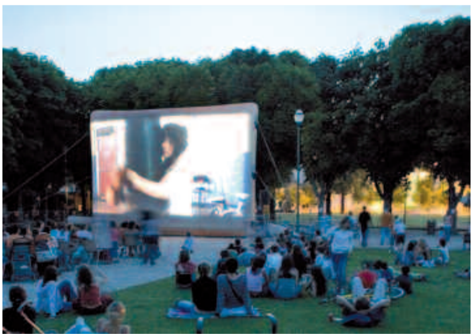
Une des grandes réussites à l'initiative du Conseil municipal des jeunes : la séance Cinéma en plein air, en juin dernier, dans le parc Charles-de-Gaulle.