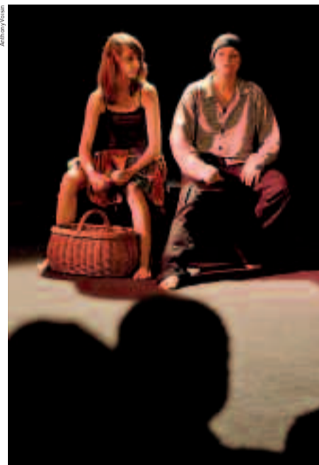
Les jeunes élèves de la section théâtre de l'Atelier 12 lors d'une représentation, en juin dernier, sur la scène du Triplex.

Journée portes ouvertes de l'Atelier 12 : samedi 16 septembre, de 10h à 12h, et de 14h à 17h, salle René-Cassin (1, rue Jean-Mermoz). Tél. : 0130863382.