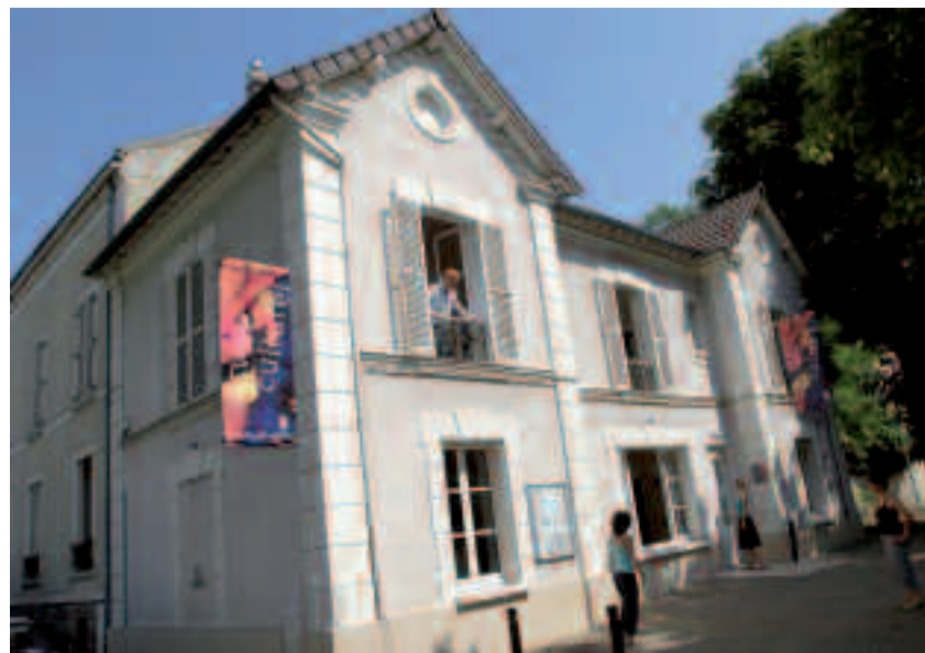
La nouvelle adresse du service culturel : 7, rue Gambetta.

Horaires d'ouverture : lundi, de 14h30 à 17h30; mardi, mercredi, vendredi, de 10h à 12h et de 14h à 17h30; jeudi, de 10h à 12h et de 14h30 à 19h; samedi, de 10h à 12h30.