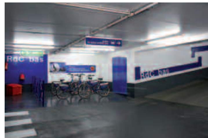
Le parc de stationnement régional a fait l'objet d'une rénovation complète de ses locaux pour un meilleur confort des usagers.

Accueil de la clientèle : du lundi au samedi, de 7 h à 20 h. Renseignements au 01 39 57 89 39.