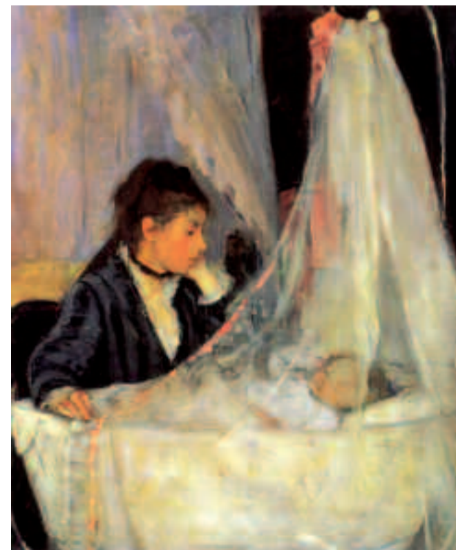
Le Berceau (1872), huile sur toile de Berthe Morisot, une des grandes peintres du XIX e siècle qui a participé à toute l'aventure du mouvement impressionniste.

Conférence audiovisuelle Femmes peintes, femmes peintres. Mercredi 13 décembre. Le Triplex (40, rue Faidherbe). Tarif : 6 €. Renseignements au 01 30 86 33 82.