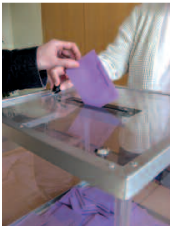
Pour exercer son droit de vote, il est impératif d'être inscrit sur les listes électorales.

Hôtel de ville, service état civil (16, rue Gambetta). Accueil : lundi, mardi, mercredi et jeudi, de 8 h 30 à 12 h et de 13 h 30 à 17 h 30 (attention : jeudi, ouverture au public à 10 h 30) ; vendredi de 8 h 30 à 12 h et de 13 h 30 à 17 h ; samedi de 8 h 30 à 12 h. Pour toutes informations complémentaires : 01 30 86 32 49 / 32 36.