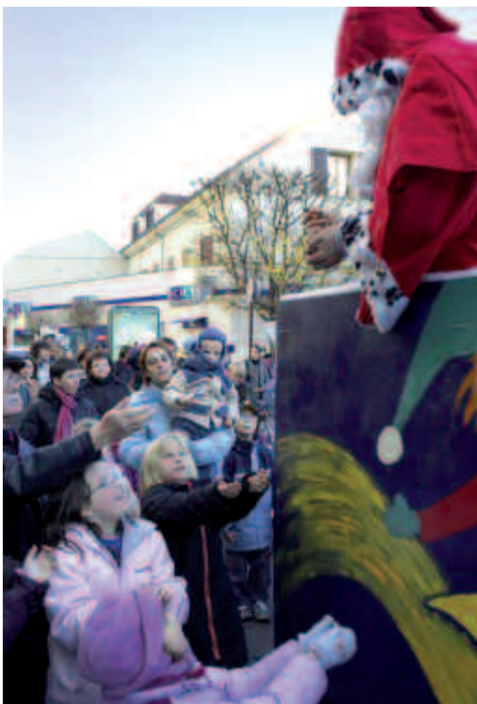
Le Père Noël distribue généreusement des friandises aux enfants ovillois.