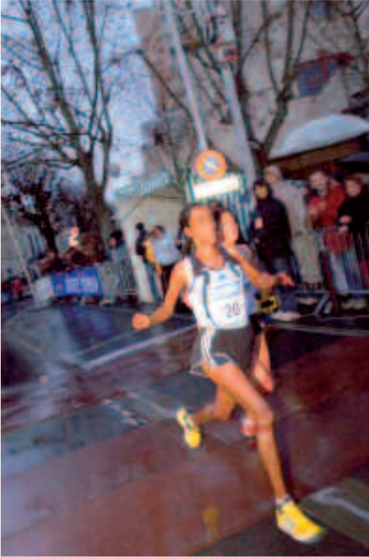
L'Éthiopien Sileshi Sihine (ci-dessous), vainqueur de la « course des as » lors de la précédente édition, s'apprête à franchir la ligne d'arrivée. Chez les femmes, sa compatriote Merima Denboba (ci-contre) remporte l'épreuve pour la troisième année consécutive.