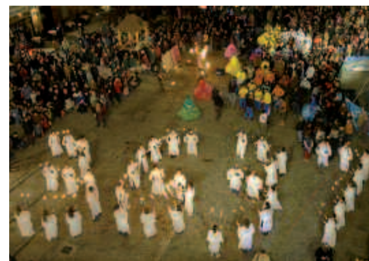
36 37, la ligne du don par téléphone et Minitel.

Le programme de toutes les animations (activités, lieux, horaires) sera mis à la disposition des Ouvillois à l'accueil de la mairie et dans les structures municipales. Il pourra aussi être consulté sur le site de la Ville : www.ville-houilles.fr Arrêts de la navette pour se rendre sur le site du Téléthon : Gymnase Brondani, Église, Croix du Martray, Mairie, Gare (coté bus), rue Robespierre. Renseignements au 01 30 86 33 70.