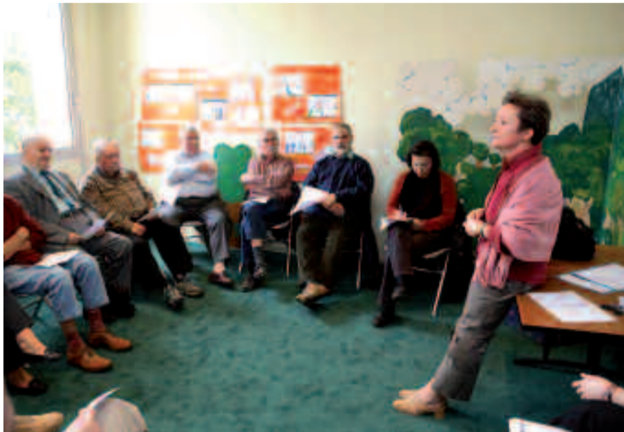
Première réunion de rédaction, à la bibliothèque Jules-Verne, pour les participants du projet « Écrire un journal ensemble ».