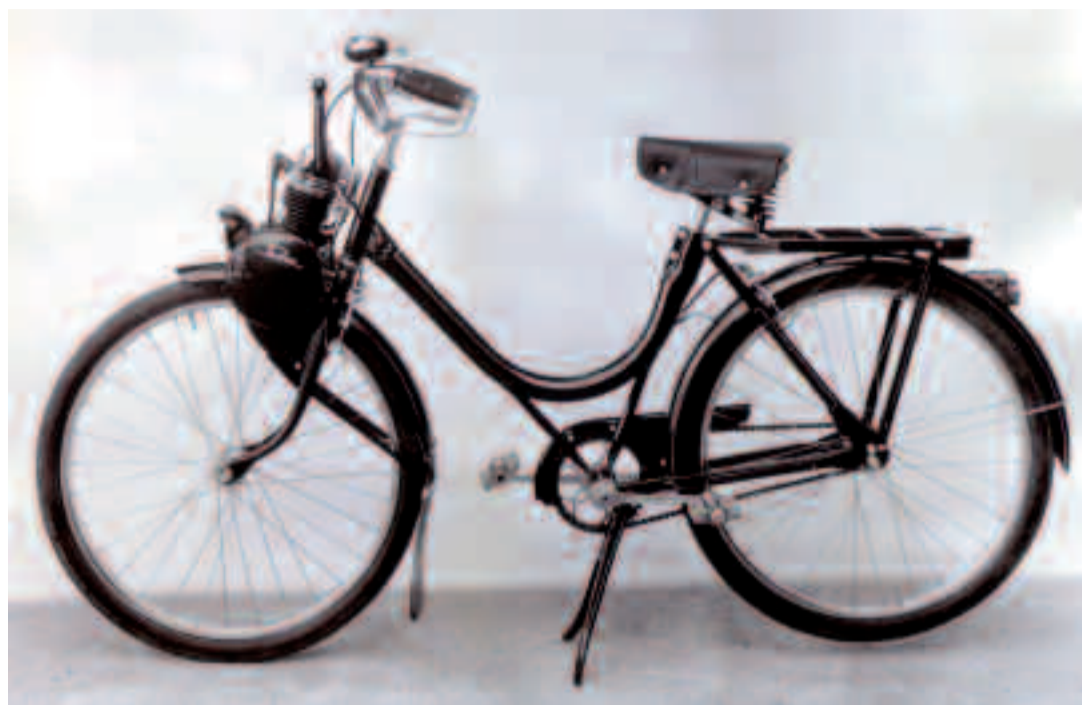
Le Vélosolex, la « bicyclette qui roule toute seule », fut une véritable star internationale, disparue en 1988.

Ce n'était ni tout à fait un vélo ni vraiment une Mobylette. L'engin ne consommait qu'un litre et demi de carburant aux 100 kilomètres. Sobre, fiable et robuste, cette drôle de machine fut l'un des mythes roulants français. C'était le fameux Vélosolex, un étonnant cycle doté d'un moteur qu'il fallait basculer sur la roue avant pour qu'un galet vous entraîne à 35 km/h.