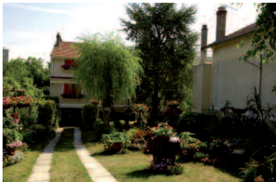
Ci-dessus : 3 e prix du concours départemental des « Maisons fleuries » dans la catégorie « Maisons avec jardins, visibles de la rue ».

Les Ovillois étaient plus d'une vingtaine à participer à l'édition 2006 du concours départemental « Maisons fleuries ». Amateurs passionnés, ils ont contribué à l'embellissement du cadre de vie en fleurissant balcons, terrasses, jardins et entrées d'immeubles. Façades et balcons, voies publiques, maisons avec jardins, restaurants et petits commerces... autant de catégories dans lesquelles les candidats ont pu exprimer leur savoir-faire. Leur réalisation a été évaluée, en juillet dernier, par un jury local, en fonction de l'originalité, du choix de végétaux et de l'harmonie des couleurs. Après transmission du classement des candidats au