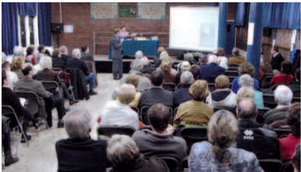
Les habitants du quartier du Centre-Ville, à l'école Maurice-Velter.

Le 15 février dernier, à l'école Maurice-Velter, le Maire s'est prêté au jeu des questions-réponses avec les habitants du quartier du Centre-Ville. Plus d'une centaine d'entre eux avaient répondu présents à cette réunion publique annuelle, la 62 e du genre organisée dans chacun des sept quartiers de la commune. Comme à l'accoutumée, les habitants ont été invités à prendre la parole pour faire part de leurs préoccupations. Les sujets les plus fréquemment évoqués portaient en grande partie sur le stationnement et la sécurité routière. Non-respect de la réglementation dans les zones bleues, problème de stationnement (rue Émile-Combes), demande d'aménagement au carrefour des rues Édouard-Branly/Camille-Pelletan,