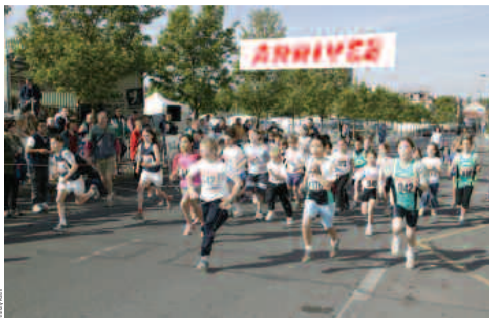
La course est aussi ouverte aux jeunes sportifs.

Inscriptions jusqu'au 21 avril : 8€ (individuels), 11€ (couples). Après le 21 avril : 10€ (individuels), 16€ (couples). Gratuit pour les enfants. Formulaire à retirer au club SOH (23, rue Gabriel-Péri). Renseignements au 01 39 15 09 75 (du mardi au vendredi, de 16h30 à 18h30).