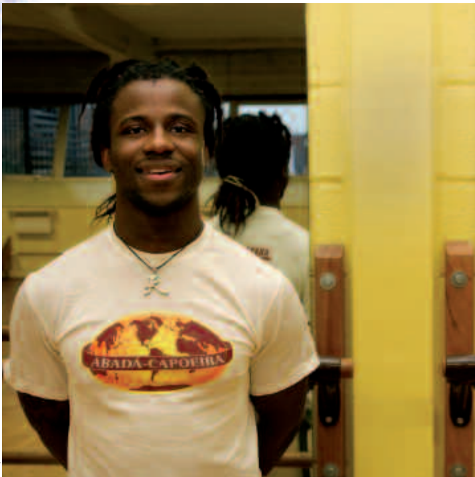
Haïti : « La capoeira, je la pratique avec mon corps, mon esprit et mon âme. »

À 25 ans, Haïti est une personnalité reconnue dans le monde de la capoeira, l'art martial brésilien.