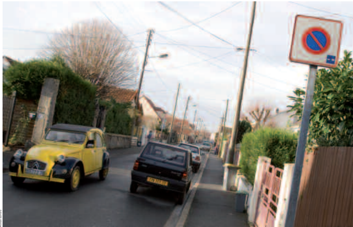
Dans les rues étroites de Houilles, respecter la réglementation en matière de stationnement contribue à rendre plus fluide la circulation et évite de se voir verbaliser pour stationnement irrégulier.

En centre-ville et dans ses alentours, le stationnement payant par horodateurs sur voirie concerne environ 1 500 places réparties sur des parcs en surface et le long des voies publiques. Ce dispositif favorise la rotation des véhicules pour donner à chacun la possibilité de se garer à proximité des commerces. De plus, il évite que des voi-