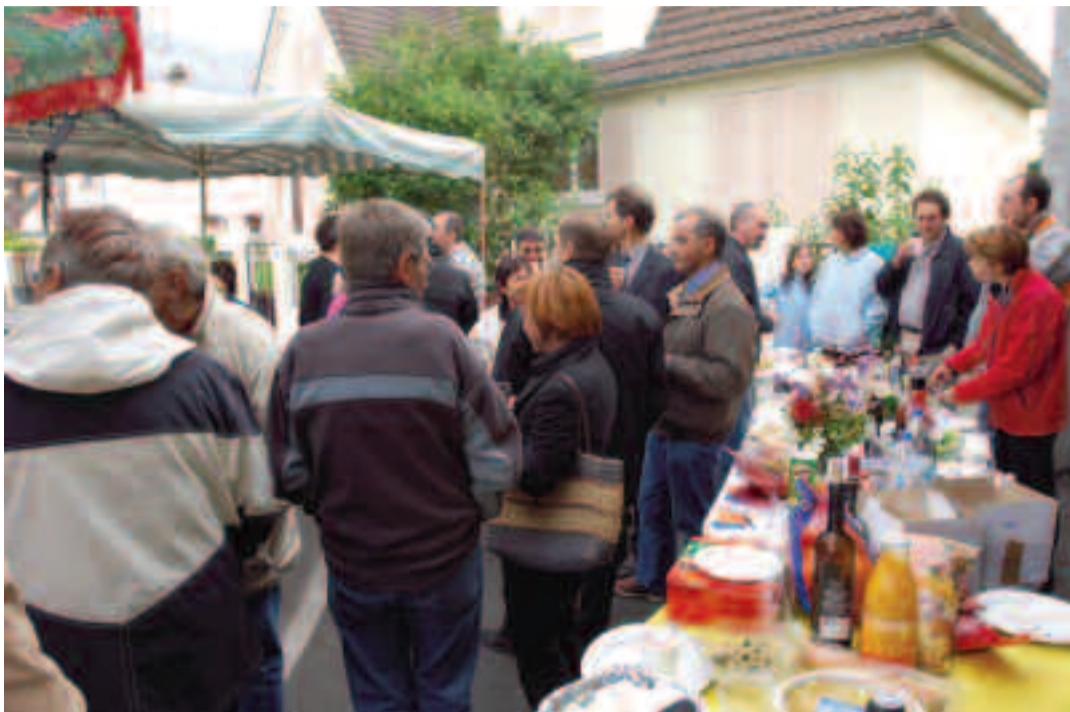
Moment de convivialité autour d'un buffet.

Depuis 1999, l'opération « Immeubles en fête » constitue un antidote à l'individualisme et au repli sur soi. Pour sa 8 e édition, la formule change de nom (La fête des voisins) mais reste identique : inviter ses voisins autour d'un buffet ou d'un repas, pour un moment de convivialité. En 2006, plus de 4,5 millions de personnes s'étaient associées à ce grand rendez-vous qui contribue à lutter contre l'isolement, notamment dans les grandes agglomérations. Cette année, l'événement se déroulera le mardi 29 mai. Il mobilisera de nombreux acteurs de la ville (habitants, élus, bailleurs sociaux, associations, conseils syndicaux, commerçants, gardiens d'immeubles) pour développer la solidarité de proximité. Dans un hall, une cour, une rue ou un jardin, il