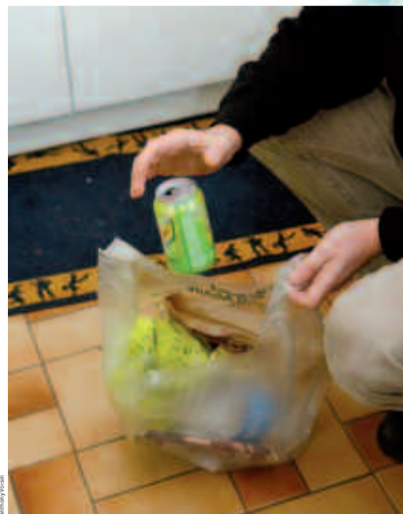
Le tri des déchets ménagers, un geste simple pour agir en faveur du développement durable.

N'hésitez pas à consulter la brochure Simplifiez-vous le tri , mise à disposition à l'accueil de l'hôtel de ville. www.ville-houilles.fr (rubrique : vie quotidienne > collecte de déchets). Pour répondre à toutes vos questions : 0 800 866 296 (appel gratuit).