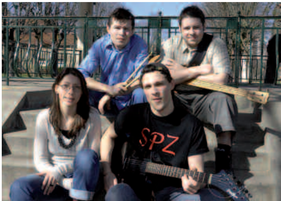
Le groupe oivillois SPZ.

bouger le public et partager avec celui-ci leur sensibilité artistique et leur passion de la scène.