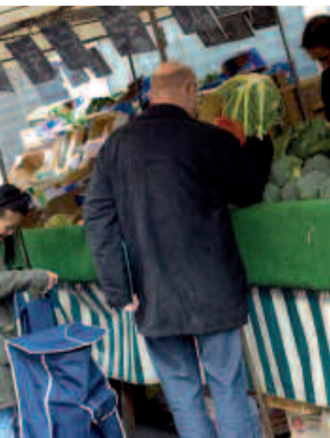
Les consommateurs recherchent de plus en plus accueil, conseil et qualité du service.