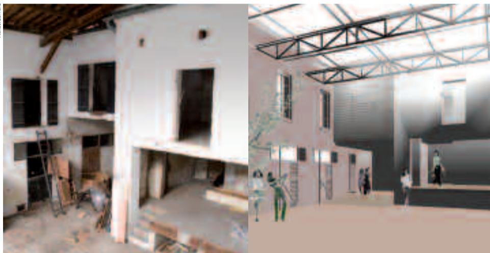
Vue actuelle de la cour intérieure de La Graineterie (à gauche) et après les travaux de réhabilitation (projet architectural à droite).