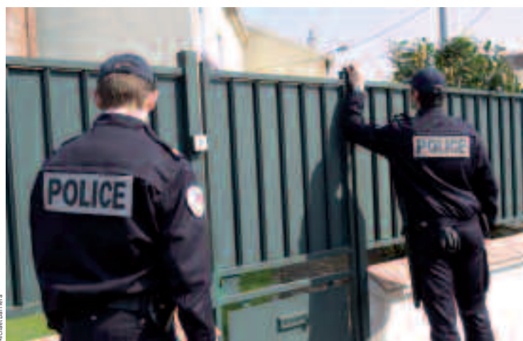
Patrouille de la police nationale dans le cadre du dispositif « Tranquillité vacances ».