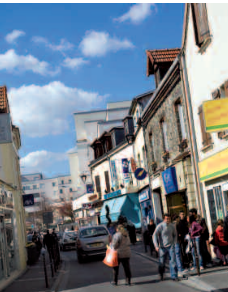
Les commerces contribuent à maintenir la convivialité dans les quartiers (ci-dessus : rue Gabriel-Péri).

À l'extérieur, avenue Carnot et place Michelet, le marché forain propose habillement, chaussures, cadeaux, accessoires et objets divers.