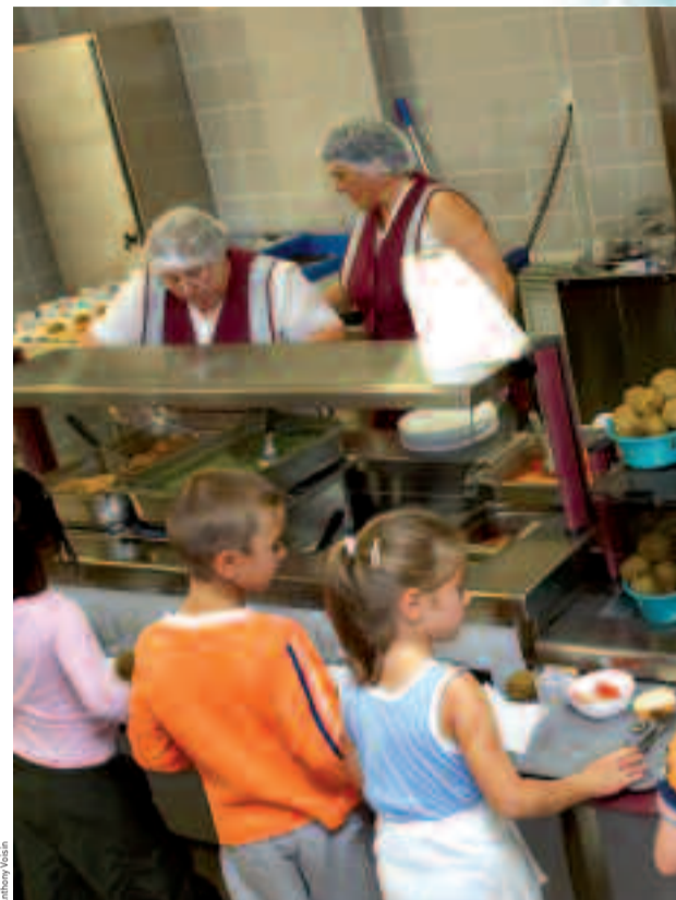
Les tarifs des prestations municipales scolaires ou périscolaires sont calculés selon le principe du quotient familial.

Service des Affaires scolaires (annexe de la mairie, parc Charles-de-Gaulle). Renseignements au 01 30 86 33 75 / 33 76 / 33 77.