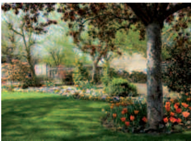
Parterres, jardinières et massifs fleuries participent à l'embellissement de la commune.

Chaque année, la Ville de Houilles participe au concours départemental « villes, villages et maisons fleuries ». Pour cette nouvelle édition 2007, les Ovillois sont invités à agrémenter de décorations florales balcons, terrasses, jardins et entrées d'immeubles.