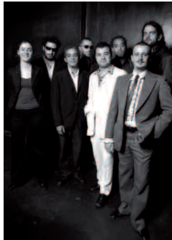
Les Shaolin Temple Defenders, une des meilleures formations de soul-funk françaises du moment.

Réservation conseillée au 01 30 86 33 82.