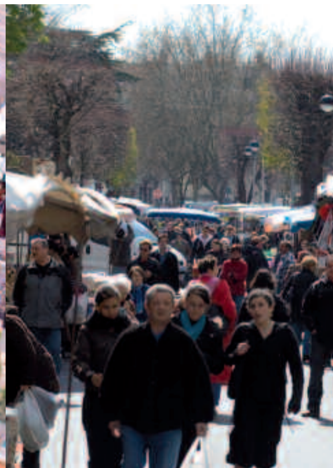
Le marché de Houilles demeure le plus actif de la boucle de la Seine. Un lieu privilégié d'échanges et d'animation.

commerces en fonction des habitudes de consommation. Liberté du commerce oblige, les pouvoirs publics en général ont peu de pouvoir pour intervenir quand un fonds de commerce change d'affectation. Le seul moyen de régulation dont dispose la Ville est la préemption. Mais seulement en cas de vente des murs et non sur les mutations de fonds de commerce. « Si la loi permet effectivement à la municipalité de préempter, la commune n'a pas les capacités financières suffisantes pour faire ce genre d'acquisition. De plus, il faut pouvoir trouver un commerçant reprenneur dans la catégorie souhaitée. Pas si simple quand la règle du jeu est celle du plus offrant », souligne l'adjoint au Maire, délégué au Commerce, à l'Artisanat et à l'Environnement.